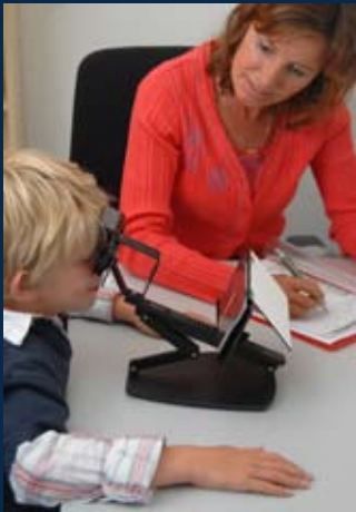
Foto: Visuele screening door een onderzoeker

Ook kan men bij hen terecht voor een screening van de visuele vaardigheden en de aanwezigheid van FD.